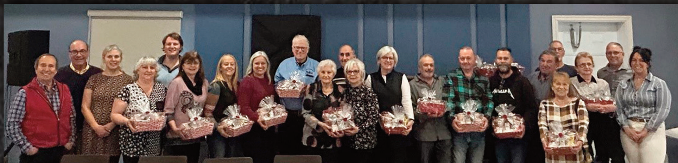
Photo des récipiendaires des prix de présence tirés au sort lors de l'événement.

Les membres du conseil municipal étaient fiers de vous recevoir pour un brunch en votre honneur le 17 novembre dernier.