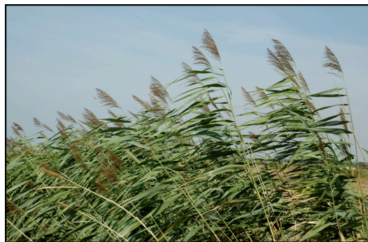
Phragmite (roseau commun)