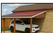
Abri d'auto attaché au bâtiment principal