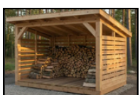
Abri à bois