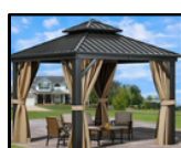
Pavillon de jardin ou de piscine